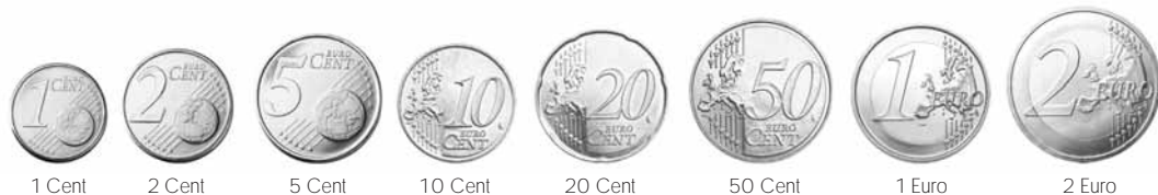
Europäische Vorderseiten der Euro-Münzen

Die Euro-Postkarten werden unentgeltlich abgegeben und sind nicht für den Verkauf bestimmt.