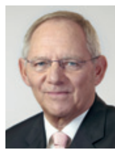
DR. WOLFGANG SCHÄUBLE

Das Bundesministerium der Finanzen wird im Rahmen der von der Bundeskanzlerin festgelegten Richtlinien der Politik vom Bundesminister der Finanzen , Dr. Wolfgang Schäuble, geleitet. Er ist als Mitglied der Bundesregierung für alle Aspekte der deutschen Finanz- und Steuerpolitik zuständig.