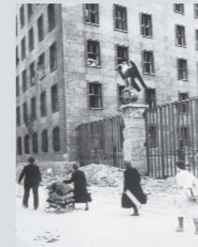
Mai 1945: Straßenszene vor dem kriegsbeschädigten Reichsluftfahrtministerium

Für die Geschichte der DDR wurde das Haus mit dem 7. Oktober 1949 zu einem zentralen Schauplatz. An diesem Tag erklärte sich hier der Deutsche Volksrat, eine Art Ersatzparlament der sowjetischen Besatzungszone, zur provisorischen Volkskammer und setzte die Verfassung der DDR in Kraft. Damit war die Teilung Deutschlands juristisch vollzogen. Nach dem Auszug der Volkskammer diente das Gebäude als „Haus der Ministerien“ der DDR. Als ein Zentrum der Regierungsgewalt wurde es am 16. Juni 1953 zum Ziel der demonstrierenden Bauarbeiter und stand im Mittelpunkt des Volksaufstands vom 17. Juni 1953.