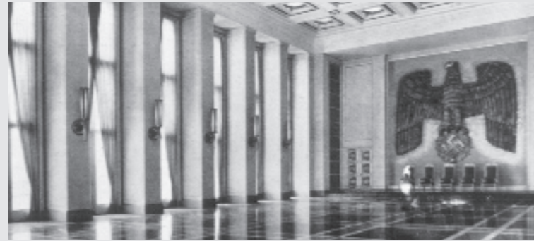
Ehrensaal zur Zeit der Naziherrschaft