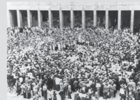
16. Juni 1953: Arbeiter protestieren vor dem »Haus der Ministerien«